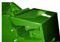
Лезо покрите захисною решіткою.

Верстат для різання арматури С32 обладнаний термомагнітним вимикачем для захисту мотора від перегрівання, забезпечен гумовими колесами для спрощення переміщення по об'єкту.